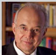
Prof. Dr. Dr. h. c. mult. Paul Kirchhof BVerfRi. a. D.

Studium der Rechtswissenschaften in Freiburg und München; 1975–1981 ordentlicher Professor an der Universität Münster; seit 1981 ordentlicher Professor an der Universität Heidelberg; 1981–2013 Direktor